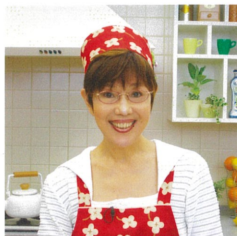
平野 レミ 氏

☆事前にご来館の上、チケットをご購入頂ける方のみとなります。発券状況により当日の午前中にチケットを販売する場合がありますので、お問合せの上、ご確認ください。